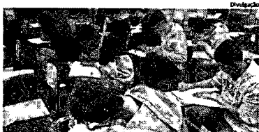
A reaplicação foi solicitada por participantes que se sentiram prejudicados

do Enem foi solicitada por participantes que se sentiram prejudica-