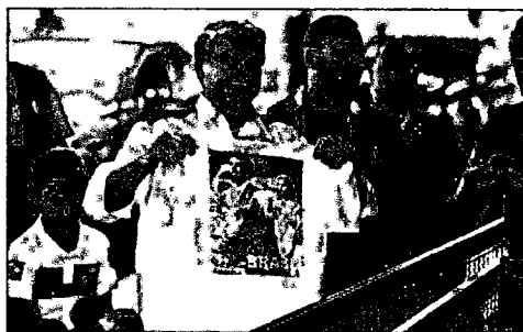
O presidente Jair Bolsonaro recebe camiseta de presente de populares no Palácio da Alvorada