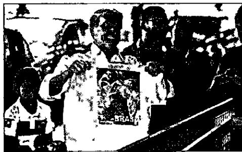
O presidente Jair Bolsonaro recebe camiseta de presente de populares no Palácio da Alvorada