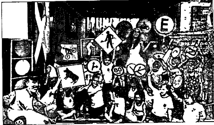
Ações de educação para o trânsito

O Governo do Maranhão, por meio do Departamento Estadual de Trânsito do Maranhão (Detran-MA) realizou, durante a Campanha Maio Amarelo 2019, 1.078 ações educativas em quase todo o estado. As atividades foram realizadas na Região Metropolitana de São Luís, e nas demais cidades pelas 15 Circunscrições Regionais de Trânsito (Ciretrans). A Campanha Maio Amarelo este ano teve como tema "No Trânsito, o Sentido é a Vida", promovendo segurança e cidadania ao conscientizar a população sobre a importância das mudanças positivas no comportamento de condutores, passageiros e pedestres para evitar acidentes e salvar vidas.