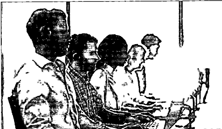
Entra em vigor nesta terça-feira (16) a lista Não Perturbe

Segundo a Anatel, se uma pessoa solicitar a sua inclusão e continuar recebendo ligações de oferta de bens e serviços de telecomunicações, ele pode ligar para o número 1331 e fazer uma reclamação. As sanções podem variar de advertência a multa de até R$ 50 milhões.