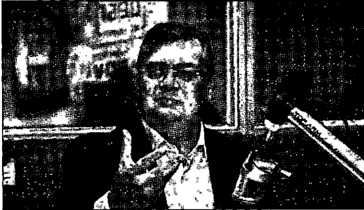
O governador Flávio Dino usou as redes sociais para comentar as reportagens

“Sergio Moro deve se afastar ou ser afastado do Ministério da Justiça. Quem instrumentalizou a Justiça Federal para fins eleitorais e partidários pode tentar fazer o mesmo com a Justiça Federal, agora sob seu comando direto”, disparou Dino.