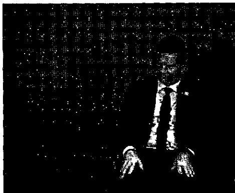
As Conferências têm como foco discutir as Políticas de Segurança Alimentar e Nutricional

A avaliação interna do Congresso, levada a Maia e a Alcolumbre já na noite de domingo por líderes partidários, é o clássico clichê das CPis: todos sabem como começam, ninguém como acabam. Isso dito, a preocupação com a manutenção de uma agenda mínima de governabilidade, a começar pela tramitação da reforma da Previdência, permeou as conversas. Se é impossível saber a extensão do dano do caso