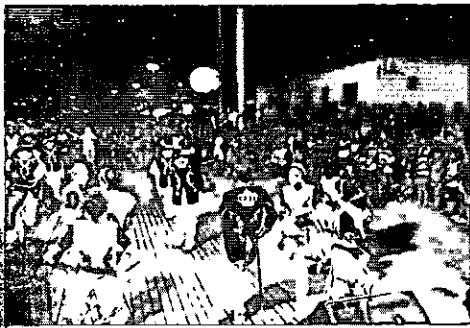
Dança portuguesa Realza de Lisboa