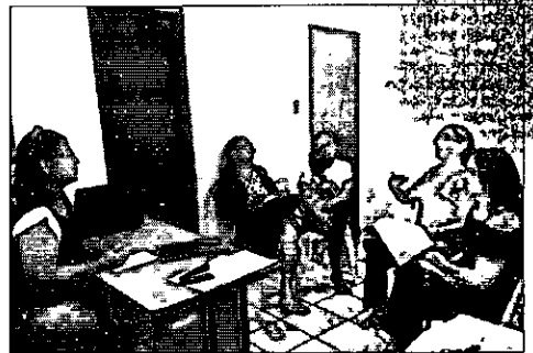
Coordenação do PAA Leite durante reunião com equipe da Secretaria de Assistência Social de Timbiras/MA