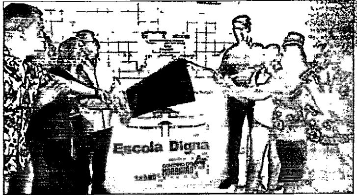
Estudantes felizes com a entrega do novo Centro de Ensino

"A escola estava deprecada, além de ser muito quente; eu, como professor, via que os estudantes não tinham estímulo para aprender. Muitos deles moram em povoado, vinham de ônibus para a escola; para chegar aqui e ainda não ter nenhum conforto. Agora, a nossa expectativa é que possamos fazer com que eles aprendam muito mais",