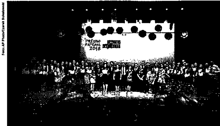
No ano passado, Prêmio Fapema contemplou mais de 50 pesquisadores em diferentes áreas do conhecimento

Com essa iniciativa, serão destinados recursos financeiros no valor total de R$ 597 mil, para apoio de projetos que podem contemplar os eixos: saúde da criança, saúde da mulher, saúde do adulto e do idoso, endemias negligenciadas e emergentes, além da assistência psicossocial. Os interessados podem submeter os trabalhos até o próximo dia 23 de agosto, e o resultado final será conhecido a partir do dia 21 de outubro de 2019.