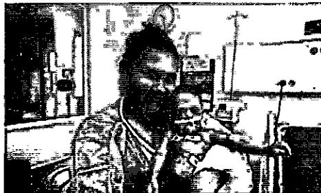
Mãe com filho em UTI