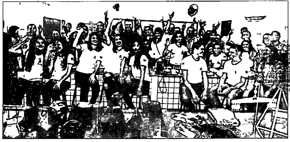
Estudantes comemoram entrega de escola com laboratórios equipados

Na manhã de ontem (29), o Governo do Estado, por meio das Secretarias de Estado da Educação (Seduc) e da Infraestrutura (Sinfra), entregou com festa, para duas comunidades escolares do município de Zé Doca, o prédio construído do Centro de Ensino Antilhon Téoplôn Ramos Rocha e a reforma e adequação do Centro Educa Mais Nelson Serejo de Carvalho, antigo CEMA, que atualmente é uma escola em tempo integral.